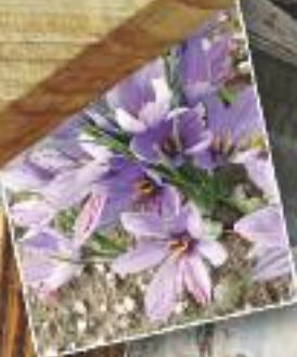
Domaine de la Safranière : week-end découverte gastronomie autour du Safran