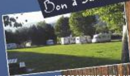
AIRE DE CAMPING-CARS À AIGUEBELLE 18 emplacements gratuits au Pré de Foire Vidange, approvisionnement en eau. Le plus : les commerces à proximité !